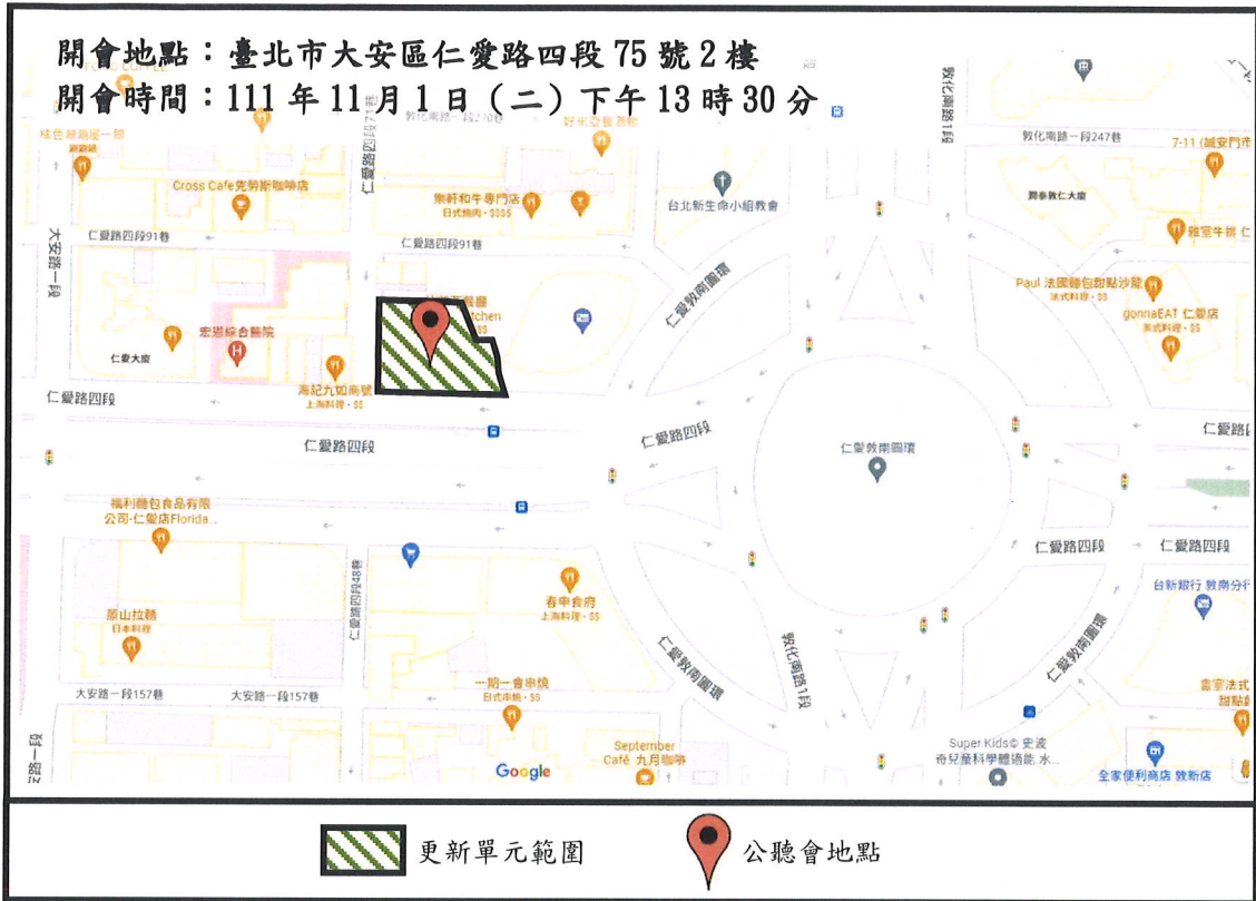
公聽會場地理位置圖